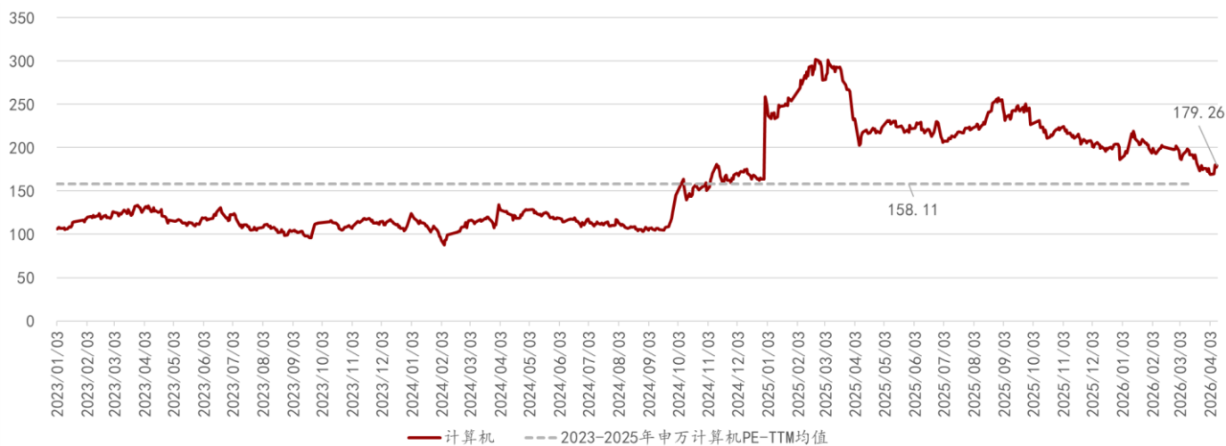
图表3: 申万计算机行业估值情况 (PE-TTM, 单位: 倍)

行业估值水平较高且高于历史中枢水平。从估值情况来看, 申万计算机行业2026年4月10日PE-TTM为179.26倍, 处于较高水平, 且高于2023-2025年历史PE-TTM的均值158.11倍。